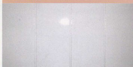
エポキシ ウレタン TS2000 TS-FX