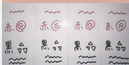
エポキシ ウレタン TS2000 TS-FX