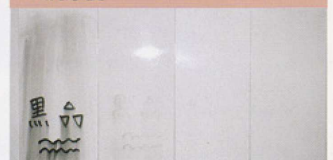
エポキシ ウレタン TS2000 TS-FX