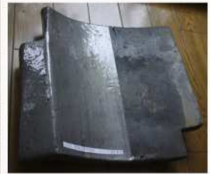
フォックSF銀黒 2回塗り