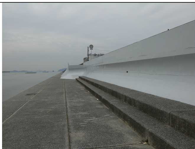
同左（広島市太田川放水路）