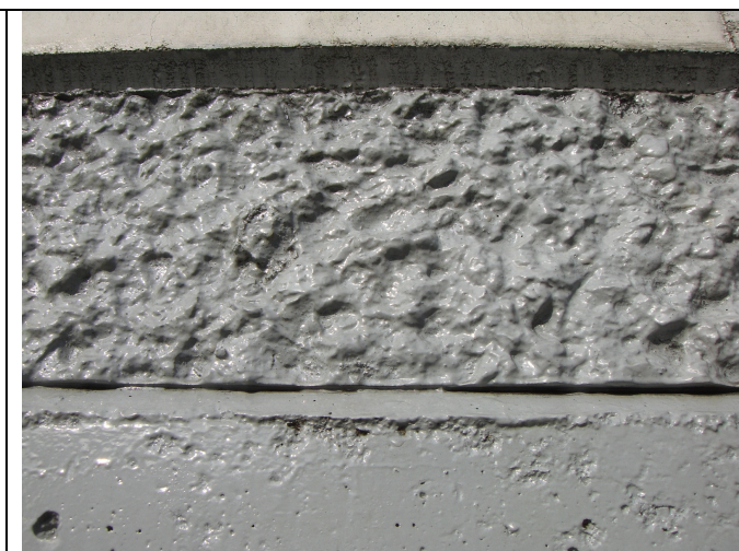
同左パイロキープ TS2000 塗膜追跡調査