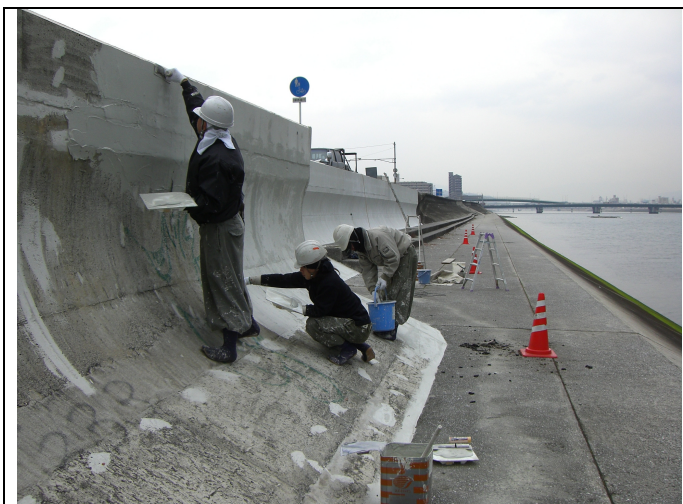
パイロキープ TS2000 沿岸護岸紡食・落書き対策