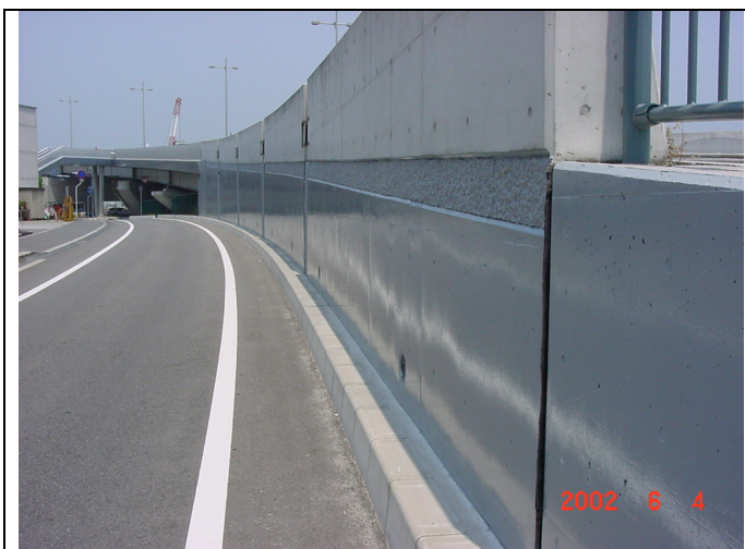
広島大橋コンクリート紡食・落書き対策