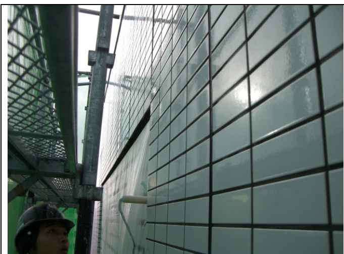
シールトン塗装直後にガラス清掃用ワイパー (レーキ) で拭き取ると写真のように大変綺麗で均一なシーラー処理が出来ました。