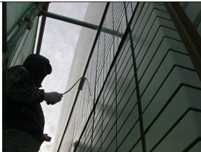
下塗り、シールトン W 塗装中