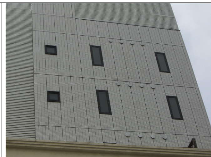
施工後大変好評です。