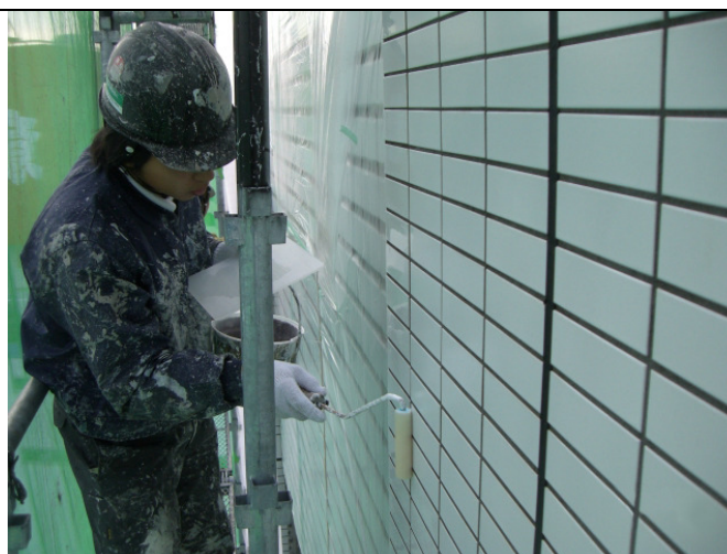
磁器コート Ti をムラ無く丁寧に塗り込みました。