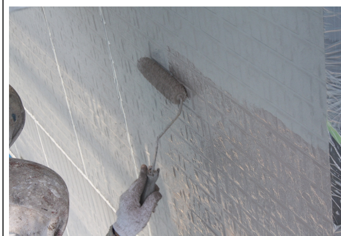
施工中 目地部塗り込み・泡噛み脱泡、要